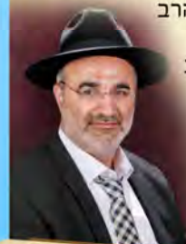
בהערכה רבה נר אצלנו